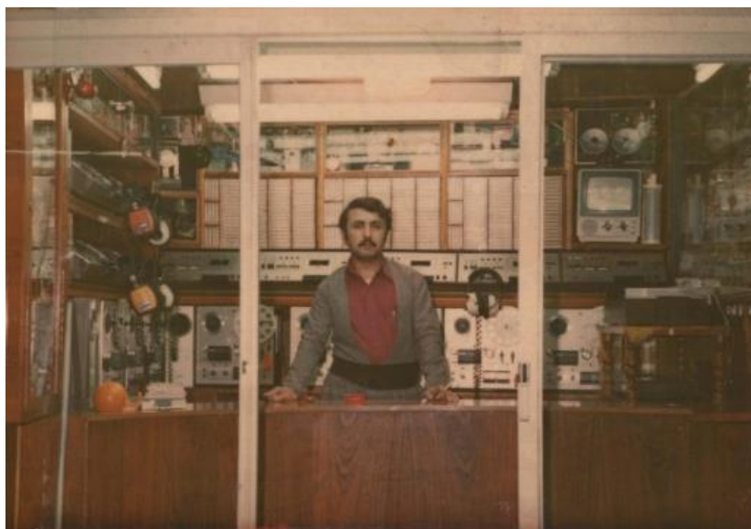
سالی 1981 مهزادخانهی سلیمانی هونهردۆست قادر رهشید