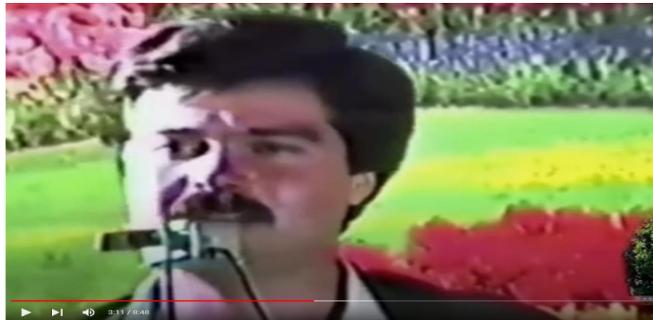
سالی 1987 بهرهم چهسهن " له مائی هونهردۆست قادر رهشید تۆمارکراوه " کامیرا جهلالی حاجی رهشید ناسراو به جهلاله قهلهو وینهی گیراوه گۆرانیهکانی بهرهم چهسهن که بۆیه کهمیین جار له مائی هونهردۆست قادر رهشید تۆمارکراوه " یادویادهوهری لای خهئک ههیهو تا ئیستاش بهزیندوی ماون بهیادیانهوه دهکری،